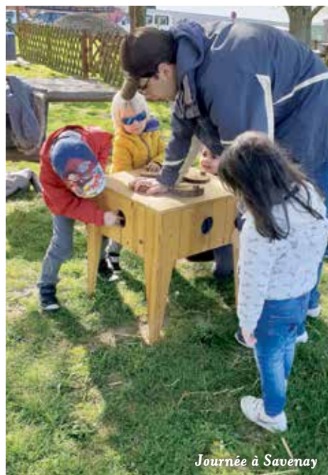
Journée à Savenay

Pour plus de renseignements sur le programme, les tarifs, les disponibilités, n'hésitez pas à vous rapprocher des Moussaillons contact : 02 40 58 98 72