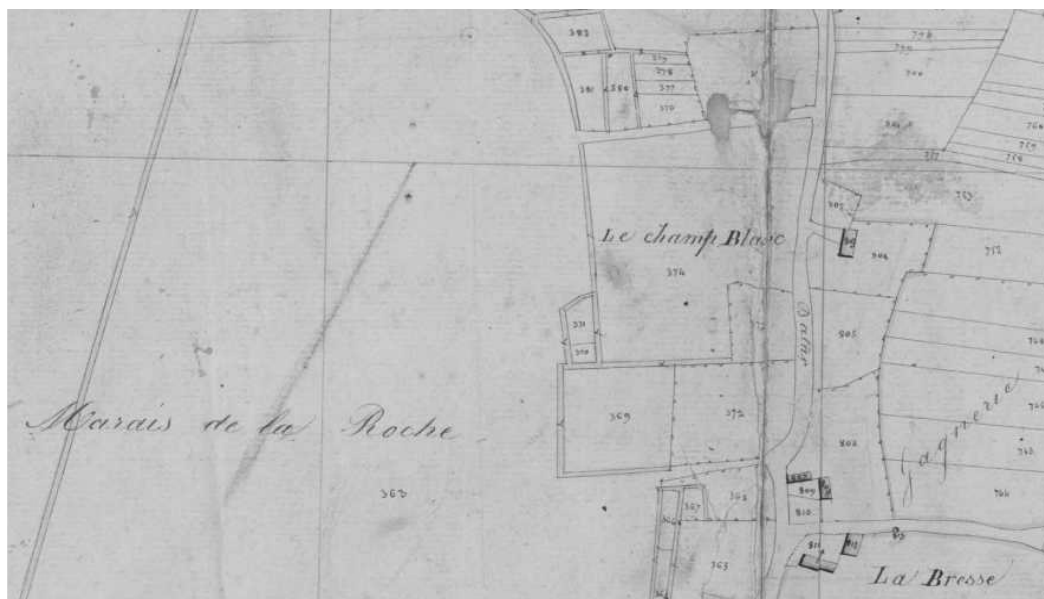
Le Champ-Blanc, avec une seule maison, tel qu'il apparaît sur le plan cadastral de 1827