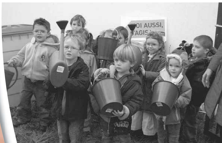
Les enfants des écoles ont été sensibilisés à la collecte des eaux pluviales et au compostage.

Moins de déchets ont été trouvés autour des colonnes.