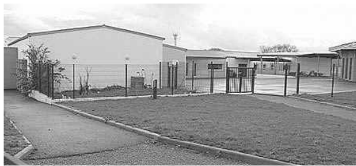
Les 2 futures classes occuperont cet espace